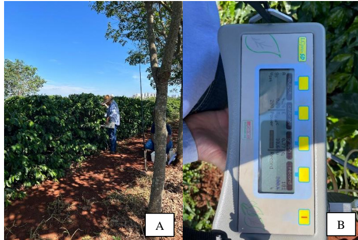
Figura 1 - Análise de parâmetros fisiológicos (A). Detalhe para o equipamento analisador de gás a infravermelho LC-Pro SD da ADC-Bioscientific LTD (B).